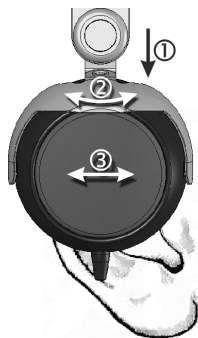
Hörer sitzt zu hoch