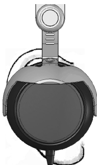
Hörer sitzt korrekt